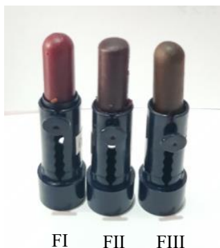
Gambar 1. Sediaan lipstik menggunakan ekstrak kulit buah jamblang

Hasil uji homogenitas dan organoleptik untuk menguji mutu sediaan lipstik menunjukkan bahwa lipstik dengan konsentrasi pewarna ekstrak kulit buah jamblang F1 berwarna pink, F2 berwarna ungu, dan F3 berwarna hijau (Gambar 1). Hasil uji organoleptik menunjukkan sediaan homogen, berbentuk padat dan berbau khas.