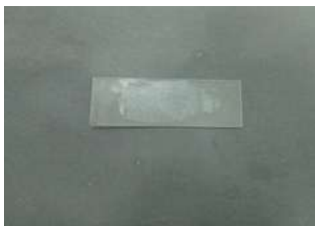
a. gambar homogenitas krim

Berikut adalah gambar homogenistas krim dan tipe emulsi air dalam minyak