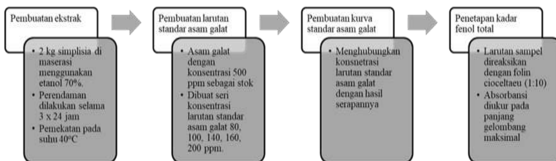
Gambar 1. Proses Kerja Uji Total Fenol 6

Alat yang digunakan yaitu pipet larva, alat-alat gelas, blender, counter untuk menghitung larva, Rotary evaporator, Stop watch, termometer, oven, cawan petri, ayakan mesh 12 dan 16, wadah transparan, pipet volume, spektrofotometer UV-Vis, frezz drying, oven pengering. Sedangkan bahan yang dipakai yaitu batang seledri, aquadest, etanol 70%, larva Artemia salina , kertas saring, PVP, laktosa, asam galat, reagen Folin-ciocalteau, Na_2CO_3 .